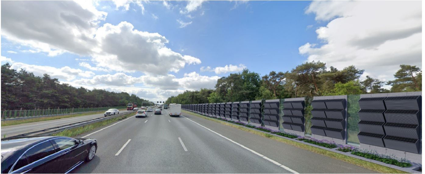
Een voorbeeld van cassettes langs de snelweg.